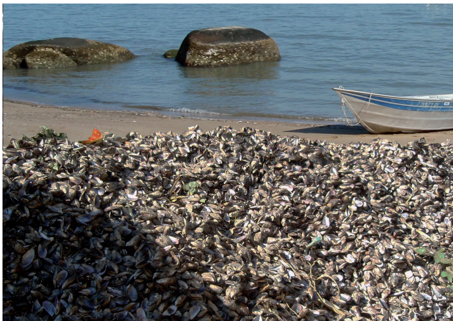
Figura 13. Conchas de moluscos indevidamente depositadas na praia

O lixo comum gerado pelas fazendas marinhas deve ser acondicionado adequadamente em lixeiras e destinado a centros de reciclagem ou a aterros sanitários. Já conchas de animais mortos podem ser aproveitadas para diversos fins, como para a construção civil, produção de suplementos alimentares, artesanato, etc. Esse material, no entanto, não pode permanecer acumulado nas unidades de apoio em terra se decompondo e gerando mau odor, tampouco pode ser jogado no mar. Caso as conchas não sejam aproveitadas para usos alternativos, elas devem ser destinadas a aterros sanitários, assim como o lixo comum.