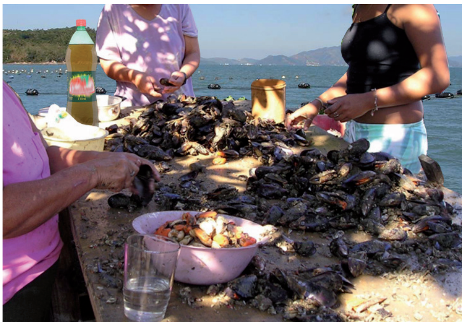
Figura 11. Trabalhadores desconchando mexilhões em balsas de manejo de moluscos, o que não é permitido pelo órgão ambiental

Desconchar moluscos em balsas, no mar, além de não estar de acordo com a legislação sanitária, gera uma grande quantidade de conchas que não podem ser descartadas no mar. Por esses motivos o órgão ambiental não permite esses procedimentos em balsas.