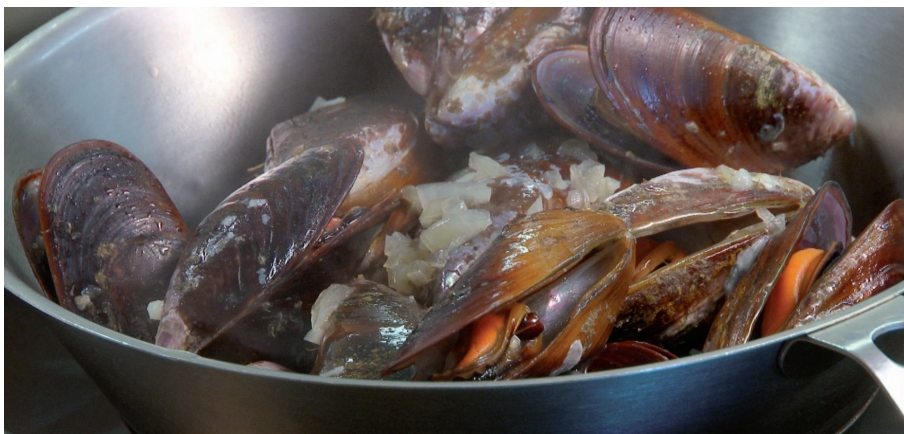
Figura 2. Mexilhões sendo preparados para o consumo

Nas formas clássicas de se produzir alimentos, como a pecuária e a agricultura, é necessária a utilização de insumos, como rações ou fertilizantes, que têm o potencial de poluir o meio ambiente. Nesse contexto o cultivo de moluscos se destaca positivamente, pois aproveita basicamente nutrientes e recursos naturais existentes nos mares, muitos deles oriundos de outras atividades humanas como a própria pecuária e a agricultura. Pode-se dizer que cultivar moluscos é uma forma de transformar resíduos de outras atividades humanas em alimento de alta qualidade.