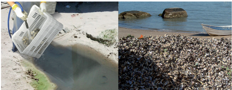
Figura 4. Conchas e resíduos da limpeza de moluscos indevidamente despejados na praia

Resíduos do manejo dos moluscos, como conchas e cracas, se não forem devidamente armazenados e destinados, entram em decomposição gerando mau cheiro e atraindo pragas, como moscas, ratos e baratas. Isso é ruim não só para o meio ambiente, mas principalmente para a saúde das pessoas. Da mesma forma, a lama resultante da lavagem dos moluscos, se despejada diretamente na beira da praia, pode comprometer a qualidade da água do mar.