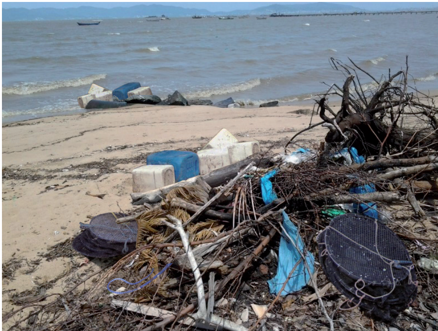
Figura 6. Materiais oriundos de cultivos de moluscos indevidamente descartados no mar e que acabaram parando na praia