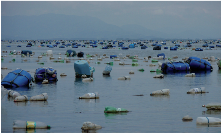
Figura 8. Área de produção de moluscos desorganizada, utilizando materiais não apropriados como flutuantes