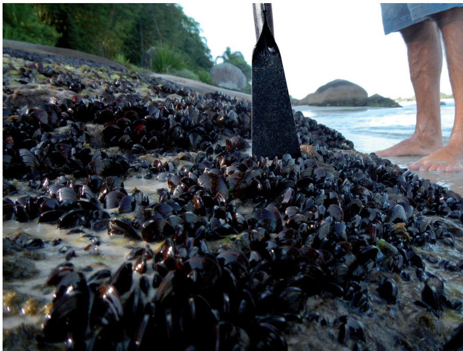
Figura 15. Sementes de mexilhões sendo extraídas de bancos naturais

Recomendamos a maricultores interessados em conhecer melhor os métodos de obtenção de sementes de mexilhão ler o “Boletim Didático - Métodos para obtenção de sementes de mexilhões alternativos à retirada de bancos naturais”, que pode ser obtido na internet ou no escritório da Epagri em seu município.