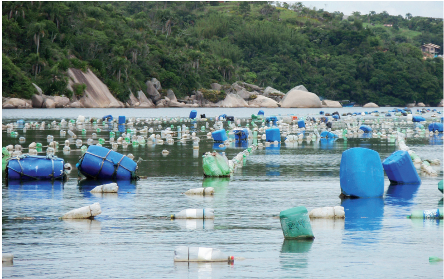
Figura 3. Área de produção de moluscos desorganizada, utilizando materiais não apropriados como flutuantes