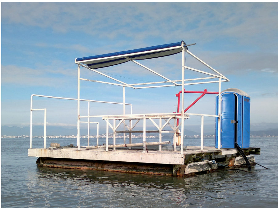
Figura 12. Banheiro instalado em balsa de manejo de moluscos sendo indevidamente esgotado no mar

Liberar esgoto diretamente no mar, além de poluir o meio ambiente, põe em risco a saúde da população em geral, incluindo a dos consumidores de moluscos, o que pode causar prejuízo aos maricultores. Áreas de cultivo com altos níveis de bactérias fecais podem ter a colheita de moluscos proibida 4 .