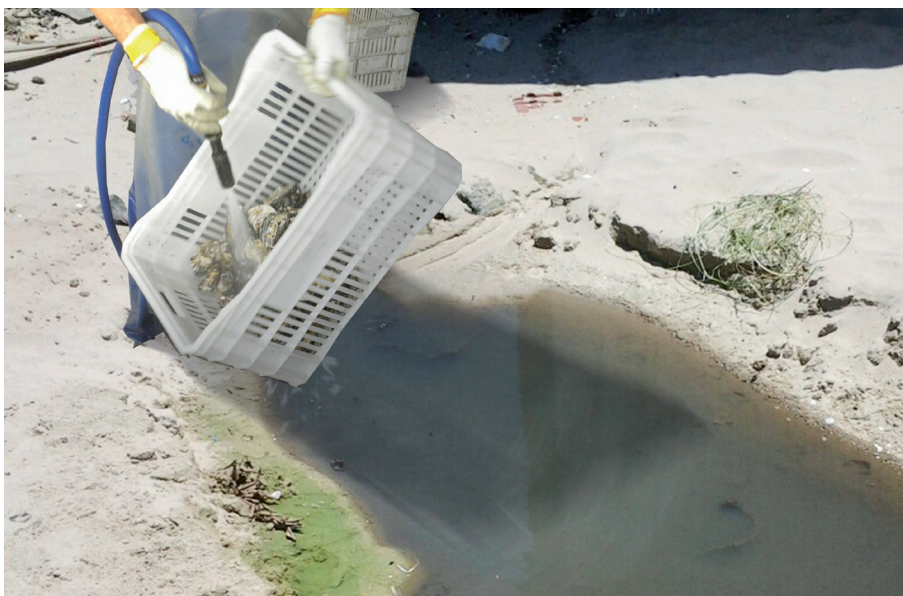
Figura 14. Resíduos da limpeza de moluscos sendo indevidamente despejados na areia da praia

A água com lodo resultante do manejo e limpeza dos moluscos não pode ser despejada diretamente na beira da praia. Da mesma forma, o esgoto dos banheiros para uso dos trabalhadores da fazenda marinha. O órgão ambiental exige que as unidades de apoio em terra possuam esgotamento sanitário, seja por meio da rede pública de coleta e tratamento de efluentes, seja por meio de uma unidade de tratamento específica do empreendimento. No caso de optarem por construir unidades de tratamento próprias, os maricultores devem procurar um profissional capacitado para projetá-las de acordo com as normas técnicas vigentes no Brasil e as características do empreendimento (tamanho, volume de produção), que pode auxiliá-los na busca pelas autorizações para construção.