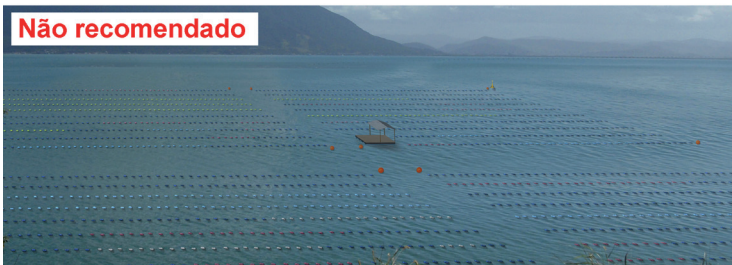
Figura 9. Exemplo de padronização de flutuadores nos parques aquícolas