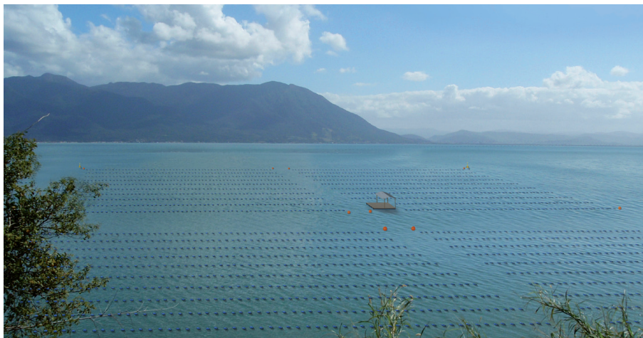
Figura 1. Fazendas de produção de moluscos bivalves bem organizadas no mar

O cultivo em fazendas marinhas permite a produção de moluscos e evita a extração desses animais de bancos naturais. Por meio dos cultivos de moluscos é possível que muitas pessoas se alimentem desse saboroso e nutritivo alimento sem que os estoques naturais sejam explorados à exaustão.