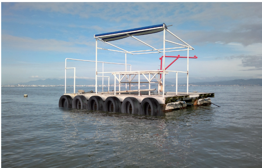
Figura 10. Balsa com pneus utilizados como defensas, o que não é permitido pelo órgão ambiental

Estudos mostram que pneus liberam substâncias nocivas à vida marinha. Por esse motivo, o órgão ambiental não permite a utilização de pneus em áreas de cultivo de moluscos. Pneus não são permitidos nem para a construção de poitas ou mesmo como defensas em balsas e embarcações.