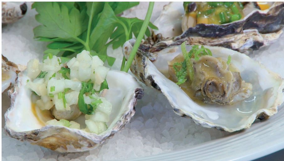
Figura 16. Prato à base de ostras

Por fim, é fundamental que maricultores tratem o mar com cuidado, seguindo as condicionantes ambientais e exercendo seu papel de agentes ambientais, para que possam continuar a produzir alimentos saudáveis, que geram seu sustento sem prejudicar o meio ambiente.