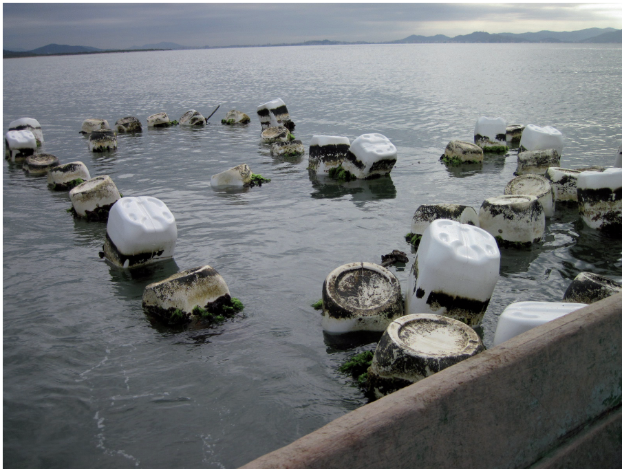
Figura 7. Longline de cultivo de moluscos rompido, à deriva no mar