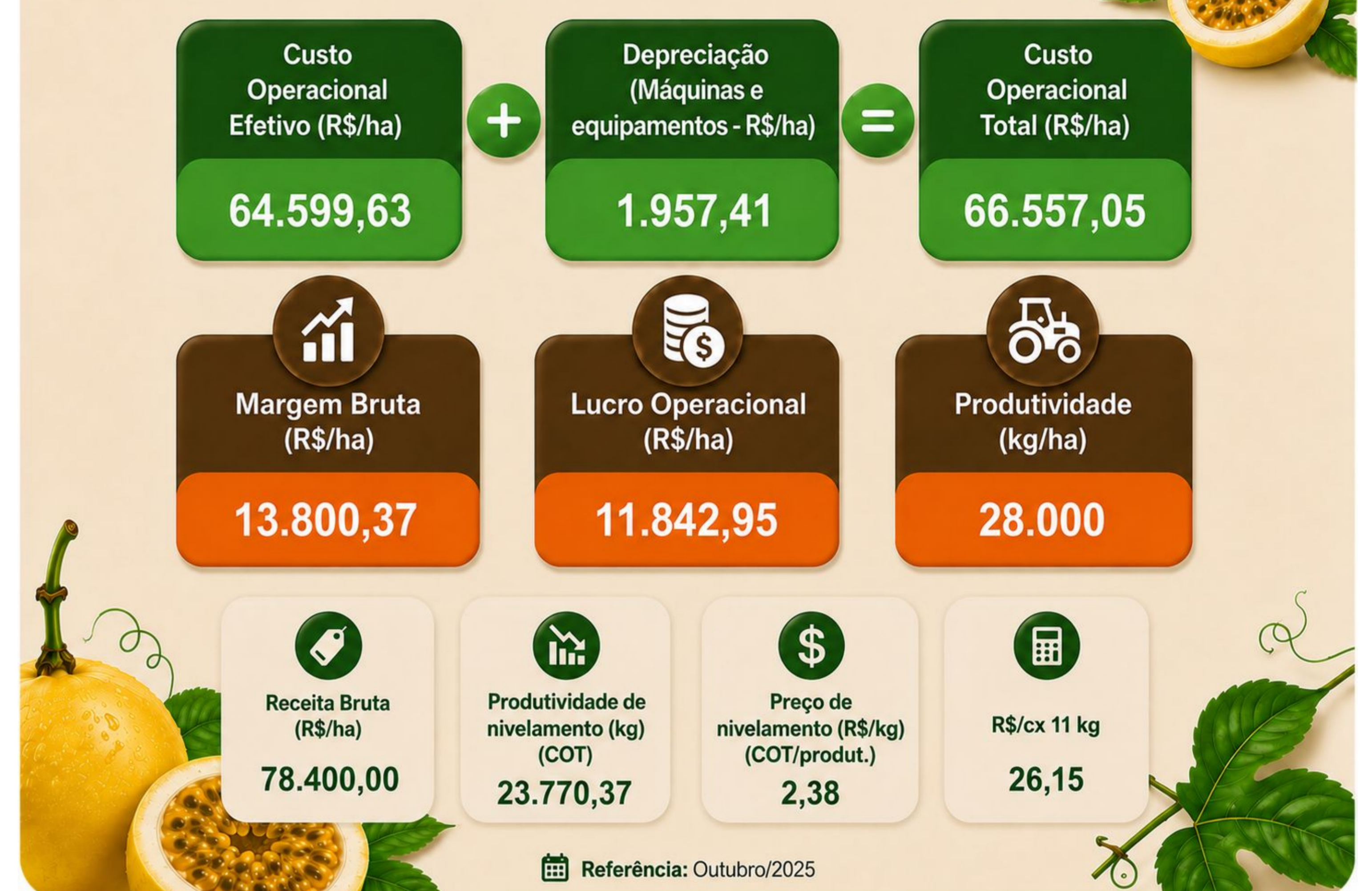
Figura 2: Indicadores econômicos da produção de maracujá em Santa Catarina.