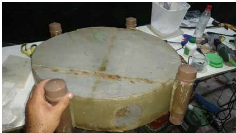
Figura 1. Cilindro berçário 1 com sementes de 1,5mm, malha de 500µm e flutuadores com canos de PVC Ø 50mm

atingam 4mm de altura e sejam transferidas para o berçário 3, onde permanecerão por 10 a 30 dias, até que atinjam 13mm e possam ser transferidas para o travesseiro 1. As ostras juvenis passam por três malhas de travesseiro (Figura 3) até atingirem a altura de concha de 50mm, o que ocorre dentro de 45 a 60 dias após sua passagem do berçário para o travesseiro 1. Ao atingir 50mm, ▶