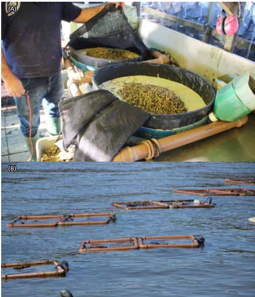
Figura 2. Cilindros berçário 2 empregados no cultivo de ostras na Fazenda Marinha. (A) Detalhe dos cilindros berçário. (B) Cilindros berçários instalados no mar. Florianópolis, SC - Brasil Figure 2. Nursery cylinders used in the cultivation of oysters at Fazenda Marinha. (A) Detail of the nursery cylinders. (B) Nursery cylinders installed at sea. Florianópolis, SC - Brasil

as ostras são transferidas para lanternas de rede, e penduradas no sistema suspenso fixo que, segundo o proprietário da fazenda, proporciona um desenvolvimento melhor das ostras a partir desta fase. As ostras acondicionadas em lanternas são peneiradas a cada 30-45 dias, e ao atingirem a altura de concha de 80mm, são colhidas ou mantidas em uma lanterna de estoque, com malha de 27,5mm entrenós.