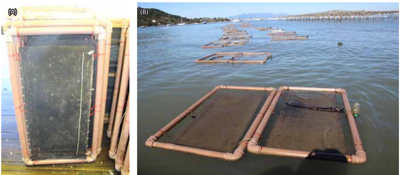
Figura 3. (A) Travessieiros flutuantes empregados na Fazenda Marinha. (B) Travessieiros flutuantes instalados no mar. Florianópolis, SC - Brasil Figure 3. (A) Floating bags used at Fazenda Marinha. (B) Floating bags installed at sea. Florianópolis, SC - Brasil

No lote de verão, as primeiras ostras foram colhidas a partir dos 160 dias de cultivo, quando atingiram a altura de 77,34mm ( \pm 6,02 ). A colheita se estendeu por mais 162 dias, totalizando um ciclo de 322 dias com 40 dias de manejo do lote. A sobrevivência deste lote foi de 28,4%, devido principalmente à predação por peixes na fase juvenil. O lote cultivado no inverno apresentou um crescimento mais rápido do que o lote cultivado no verão, com as primeiras ostras atingindo o tamanho comercial de 90,01mm ( \pm 8,76 ) após 122 dias (Figura 4). A colheita se estendeu por mais 238 dias, totalizando um ciclo de 360 dias com 50 dias de manejo do lote. A sobrevivência do lote de inverno foi de 36,6%.